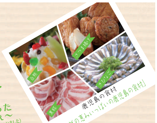
鹿児島の食材 「自然の恵みいっぱい! 鹿児島の食材」