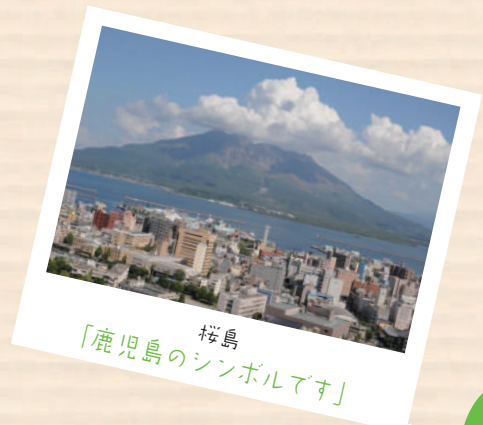
桜島 「鹿児島のシンボルです」