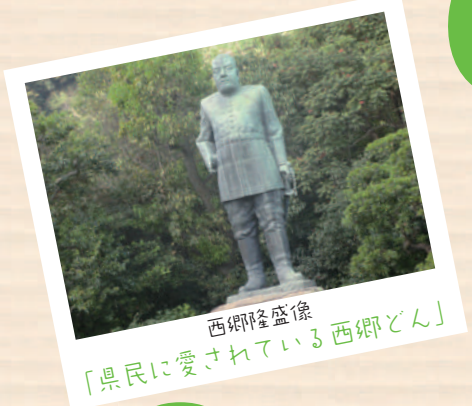
西郷隆盛像 「県民に愛されている西郷どん」