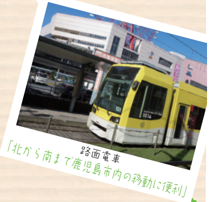
路面電車 「北から南まで鹿児島市内の移動に便利」